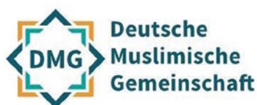
Logo Deutsche Muslimische Gemeinschaft