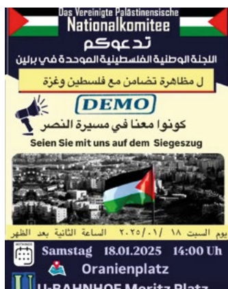
Plakat Demonstration Vereinigtes Palästinensisches Nationalkomitee

Durch das terroristische Massaker der Hamas, des „Islamischen Dschihad in Palästina“ (PIJ) und ihrer Verbündeten am 7. Oktober 2023 und den darauffolgenden Krieg im Gaza-Streifen ist die internationale Aufmerksamkeit seit über zwei Jahren ununterbrochen auf den palästinensisch-israelischen Konflikt („Nahostkonflikt“) gerichtet. Während die katastrophale humanitäre Lage in Gaza ein berechtigtes Interesse erregt, versuchen Islamist:innen der Hamas und des PIJ diese Aufmerksamkeit für ihre Agenda zu nutzen, indem sie zusätzlich zu ihren Kampfhandlungen einen Medienkrieg führen. In diesem versuchen sie sich für ein westliches Publikum als Widerstandsorganisationen aller Palästinenser:innen zu inszenieren.