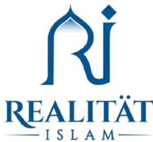
Logo Realität Islam