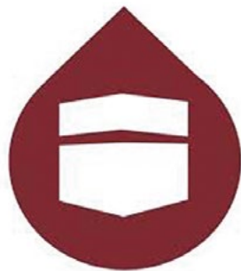
Logo Muslim Interaktiv

Die Berichterstattung dieser Organisationen über gesellschaftlich relevante Themen ist fast ausschließlich negativer Natur. Es geht um Muslimfeindlichkeit in Deutschland und globale Ungerechtigkeiten, die den Zuschauer:innen muslimischen Glaubens aus dem Herzen sprechen sollen. Gefühle wie Wut, Angst oder Ohnmacht werden nicht aufgegriffen, um auf konstruktive Weise bearbeitet zu werden, sondern es wird eine bestehende Spaltung zwischen der deutschen Mehrheitsgesellschaft und der „unterdrückten“ muslimischen Minderheit betont und verschärft. Muslimische Jugendliche sollen damit an ihre vermeintlich islamische Identität erinnert werden, die in der Propaganda der Organisationen als mit der deutschen Gesellschaft inkompatibel und dauerhaft bedroht dargestellt wird.