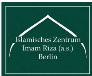
Logo Islamisches Zentrum Imam Riza Berlin