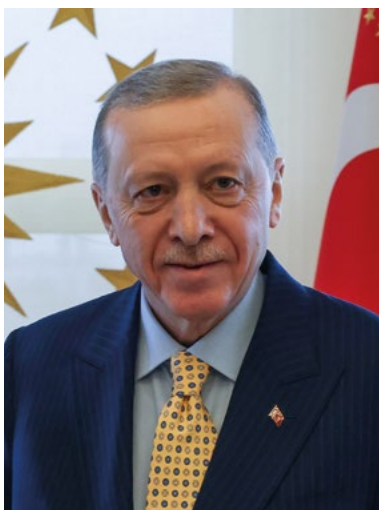
Recep Tayyip Erdoğan

Erbakan gründete nicht nur islamistische Parteien in der Türkei, sondern auch die Bewegung Millî Görüş („Nationale Sicht“). Schon in den 1970er Jahren entstanden Ableger von ihr in Deutschland. Heute firmieren sie als „Islamische Gemeinschaft Millî Görüş“ (IGMG) mit Sitz in Köln. Eigenen Angaben zufolge unterhält die IGMG in Deutschland über 300 Moscheen, darunter mehrere in Berlin. Das Logo der IGMG zielt Europa auf grünem Grund, das von einem Halbmond – ebenso wie die grüne Farbe ein Zeichen des Islams – den Kontinent umschließt. Die Anhänger von Millî Görüş nutzen den „Tauhid-Gruß“ – den in Luft gehobenen rechten Zeigefinger – und die Flagge des Osmanischen Reiches: drei weiße Halbmonde auf grünem Grund, die die Herrschaft über die Kontinente Asien, Afrika und Europa symbolisieren. Auf Autos der Anhängerschaft finden sich die Unterschrift des Gründers Necmettin Erbakan sowie die Zahlenkombination 1453 , womit auf die Eroberung Konstantinopels und damit Europas Bezug genommen wird. Letzteres auch in Kombination mit verschiedenen Herrschaftssiegeln von osmanischen Sultanen, sogenannten Tughras. Offiziell betont die IGMG heute Integrationsbereitschaft, dennoch versteht sie der Verfassungsschutz als legalistisch-islamistische Organisation.