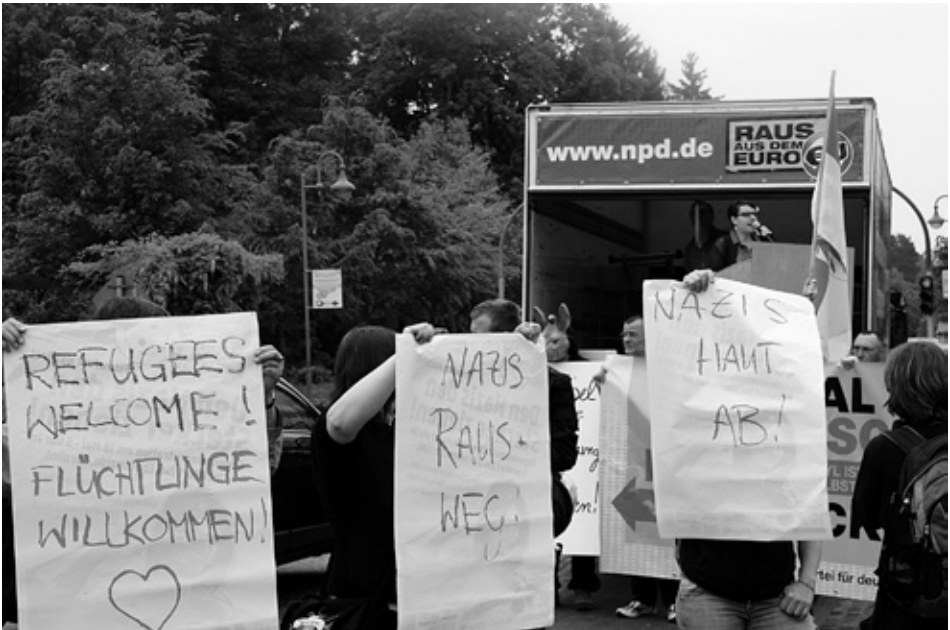
Die rassistische Mobilisierung der NPD bleibt nicht unkommentiert: In Wanditz stellen sich DemokratInnen den Neonazis in den Weg.