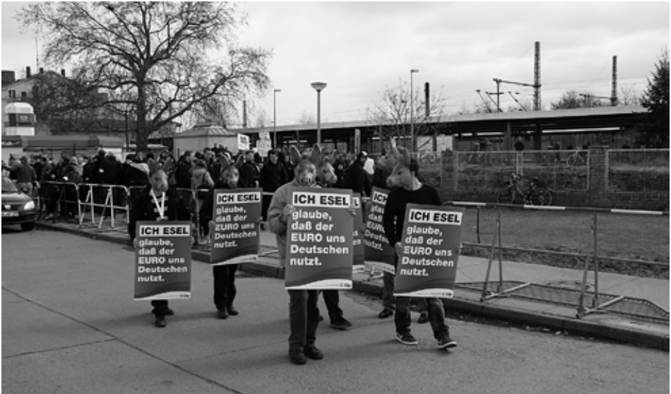
Raus aus dem Euro und zurück zur DM: NPD Aktivisten mit Eselsmasken bei einer Demonstration 2012 in Brandenburg Havel.

Die Europäische Union und die gemeinsame Währung Euro sind der NPD ein Dorn im Auge. „Raus aus dem Euro“ war und ist eine der wichtigsten Forderungen der NPD der letzten Jahre. Ihre Ablehnung der „Zwangseinheitswährung“ EURO, ebenso die Feindschaft gegenüber der Europäischen Union erklären sie folgendermaßen: „Ein Staat, eine Regierung und eine Währung funktionieren nicht, wenn sie auf Gleichschaltung und Bevormundung verschiedener Völker und Volkswirtschaften beruhen“. Die NPD tritt für einen Austritt aus der EU ein, der auch vertraglich möglich sei.