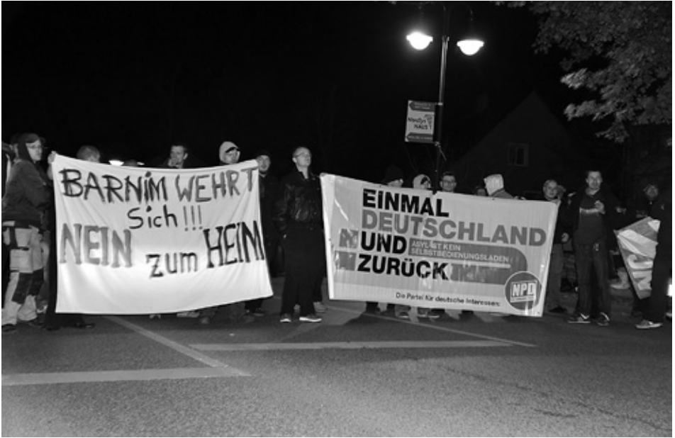
Neonazis der NPD demonstrieren in Zepernick gegen Asyl und bekommen Unterstützung vom Berliner Ableger der Partei Die Rechte.