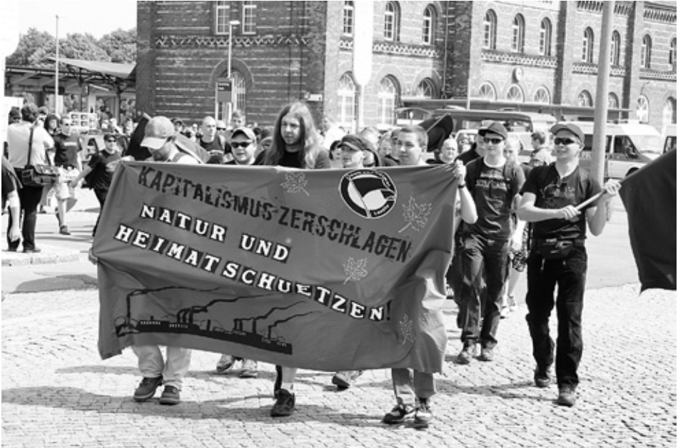
Naturschutz versus Kapitalismus: NPD Aktivisten mit Transparent bei einer NPD Demonstration in Spremberg.

Deutlicher bringt die NPD diese Auffassung in ihrem Parteiprogramm zum Ausdruck, dort heißt es der Naturschutz dürfe nicht dem „enthemmten Wirtschaftswachstum“ zum Opfer fallen, sondern müsse wirtschaftlichen Interessen übergeordnet werden. Konkret heißt das, dass auch die kleinste Beeinträchtigung der Natur vor wirtschaftlichen Interessen als auch der Schaffung von Arbeitsplätzen steht. In einer demokratischen Gesellschaft geht es aber um die Aushandlung unterschiedlicher Interessen. Für die Umsetzung der Devise „Naturschutz vor wirtschaftliche Interessen“ ist für die NPD der diktatorische Einparteiensstaat zuständig, der über das „Gemeinwohl“ der „Volksgemeinschaft“ entscheidet.