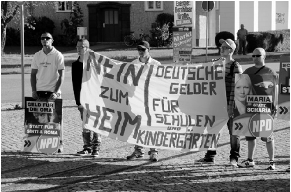
Bundtagswahlkampf der NPD – Kundgebung gegen Ausbau der Asylunterkunft am 7. September 2013 in Rathenow.